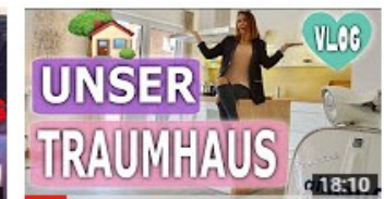
TRAUMHAUS GEFUNDEN ? ÜBERRASCHUNG FÜR DIE... 58.142 Aufrufe • vor 1 Monat