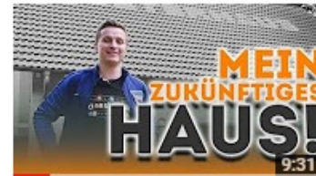
Mein zukünftiges HAUS !!! 218.649 Aufrufe • vor 1 Monat