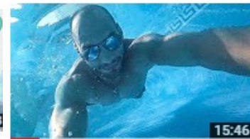
HAUSKAUF GEPLATZT!! 270.297 Aufrufe • vor 1 Monat