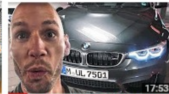
MIT DEM BMW M4 UNTERWEGS! 190.695 Aufrufe • vor 2 Wochen