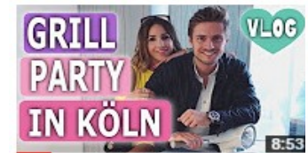
GRILLPARTY IM TRAUMHAUS | ZUSCHAUERTREFFEN | GZSZ... 24.478 Aufrufe • vor 2 Wochen