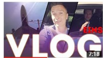
Aarons Welt "VLOG 1" 105.759 Aufrufe • vor 1 Woche